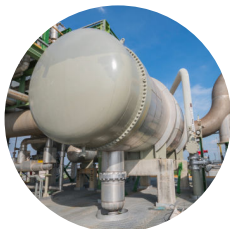
СОСУДЫ ПОД ДАВЛЕНИЕМ И КОТЛЫ